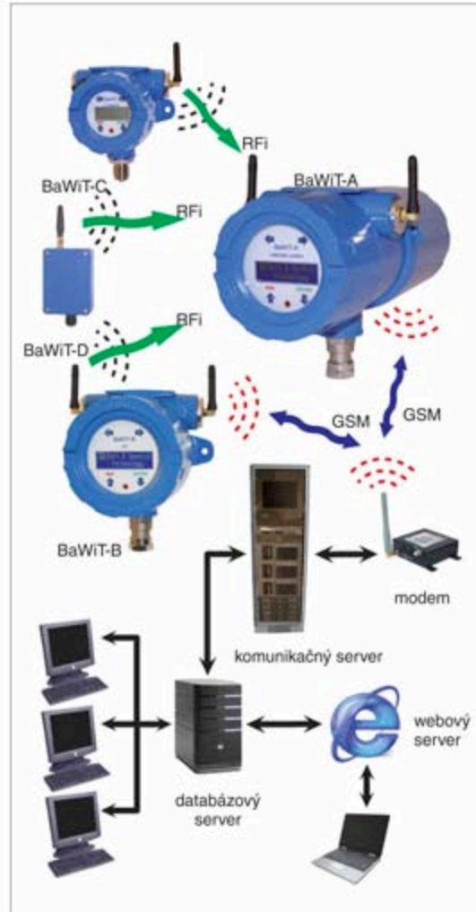
Obr. 1. SCT-Telemetry – schéma zberu údajov a komunikácie v systéme