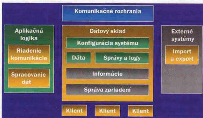
Logická schéma systému pre automatizovaný zber a spracovanie dát z batériových telemetrických systémov

analytické nástroje pre jej sledovanie. Medzi dôležité funkcie patria tiež komunikačné štatistiky, hlavne vyhodnocovanie chybovosti komunikácie a sledovanie preneseného objemu dát, teda nákladovosti celej komunikácie. Tieto štatistiky sú potom podkladom pre doladenie komunikačných parametrov systému a ich ekonomickú efektívnosť.